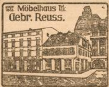
Möbelhaus Gebr. Reuss.

Für Messer geeignetes Haus in der Nähe einer Kreisstadt zu vermieten. Näh. bei H. Stoll, Jockey- billaagentur, Limburg.