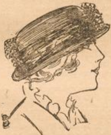
Fescher jugendlicher Hut mit Pompons u. Blumen garn. von M. 5.50 an.