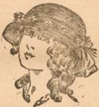
Chicker Mädchen-Hut mit Blumenranke garniert von M. 4.50 an.