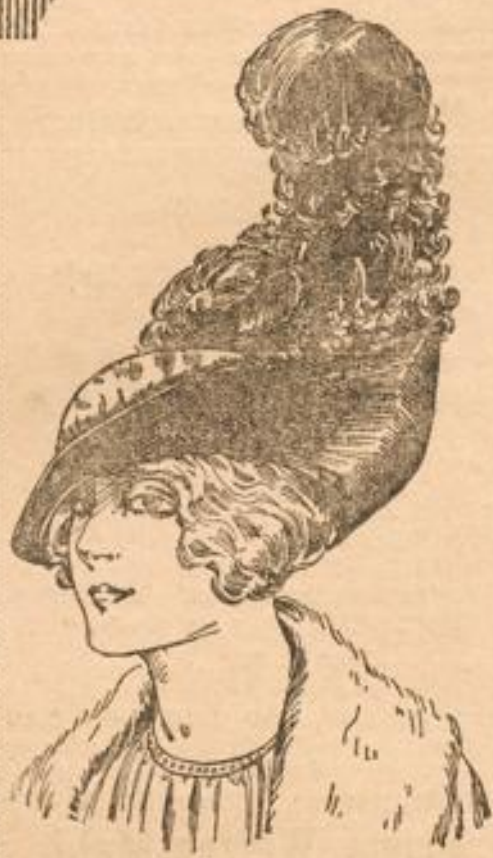
Eleganter Damen-Hut mit Straussfeder-Garnitur in jeder Preislage.